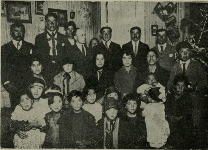
Un grupo de la congregación de Natales (Véase al frente)

En este nuevo año esperamos una buena cosecha, porque muchos asistentes a los cultos han dado sus