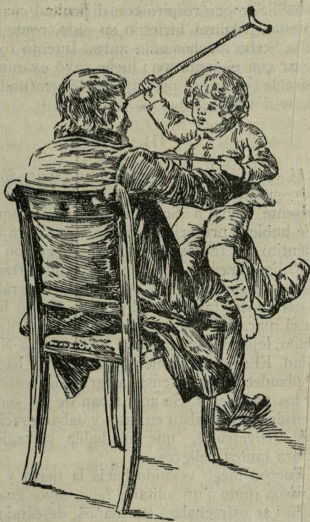
Scrooge, un segundo padre para Tomasito

Scrooge se impresionó hondamente; pero no se atrevió a apartar la sábana del rostro del difunto. Cuando hubieron abandonado la habitación, Scrooge preguntó al fantasma quién había sido el hombre que había en la cama. El fantasma señaló con su huesudo dedo hacia adelante, y condujo a Scrooge a un cementerio. Allí había una tumba descuidada, medio cubierta de yerbajos, y en la piedra leyó Scrooge con terror: EBENEZER SCROOGE. Respiró con dificultad y asió la mano extendida del fantasma, suplicando le dijero si las cosas que le había mostrado no podían cambiar, si llevaba él una vida distinta. El fantasma le rechazó, pero Scrooge no quería soltarle, cuando, de repente, el rostro del fantasma fué cambiando, hasta quedar convertido en un boliche de cama.