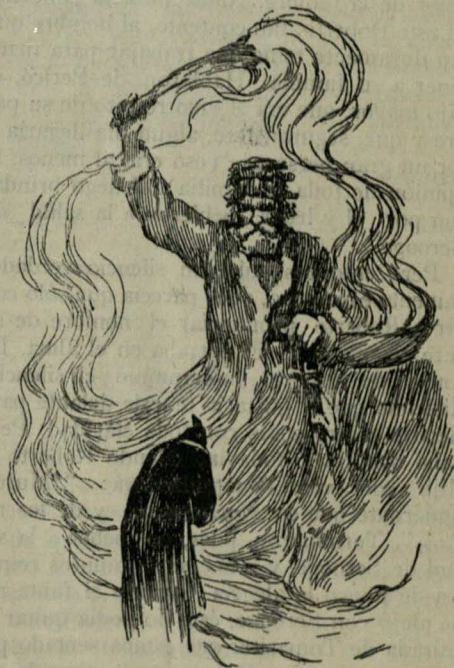
El Fantasma de la Nochebuena presente

tío y cómo éste se había deshecho de él. A estas palabras, todos volvieron a reírse con ganas, y, cuando añadió que el pobre viejo, probablemente, estaría ahora solo en su cuarto y que le daba lástima, la sobrina de Scrooge, es decir, la joven y bella esposa de su sobrino, dijo que le estaba bien empleado, por ser tan adusto y poco social. Después hubo música. La sobrina de Scrooge cantó, acompañada del arpa, una canción favorita del viejo, que éste había oído muchas veces de su hermana, la madre de su sobrino. Luego jugaron a la gallina ciega. Un amigo del sobrino de