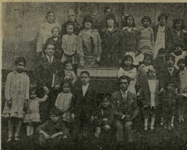
La E. D. de Cerro Toro

¿Ud. estaría dispuesto a ir? Sin vacilación le contesté: