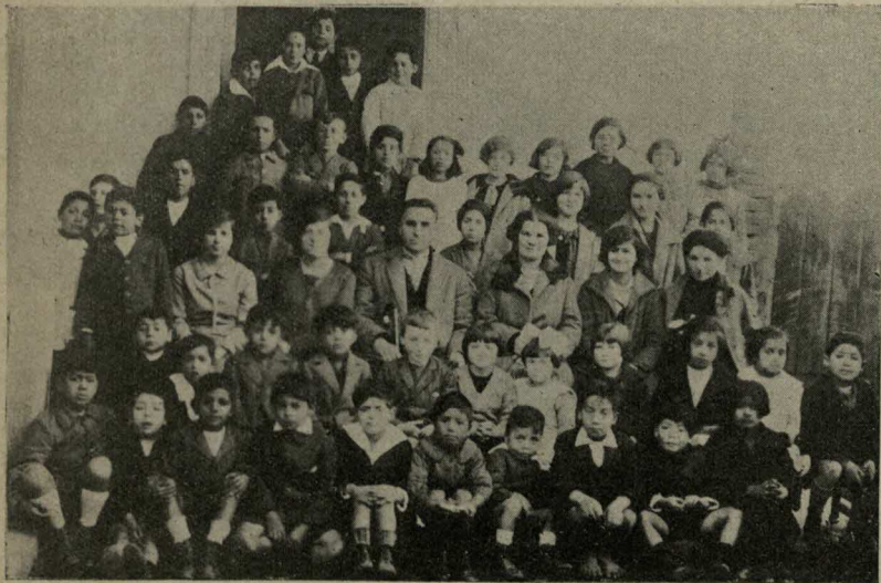
Un grupo interesante del Departamento Primario de la Escuela Dominical de la Iglesia Metodista de Concepción