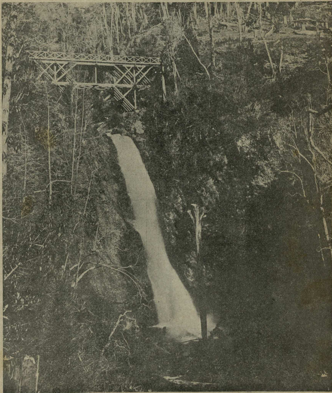
Cascada de Casa Pangui