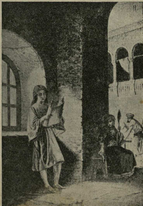
El Niño Jesús y las Escrituras

Y con el ánimo de apaciguarlo y agradarlo uno de los cortesanos insinuó que podía lanzar una proclama diciendo que la reina rebelde perdía su título y que sería arrojada del palacio. Si el rey no hubiera estado intoxicado podría haber comprendido que la reina tenía razón al negarse a venir y no hubiera sentido tales deseos de castigarla. Pero en ese estado de medio-idiotéz en que se hallaba, dijo, con voz de trueno, que ere ese el mejor consejo y envió un mensajero a los departamentos reales de la reina para que la despojara de sus atavíos y de su corona porque perdía su rango de soberana. Vestida modestamente, a pié y sin acompañantes, salió la que había disfrutado de todos los esplendores de la Corte, como una pobre menesterosa—en com-