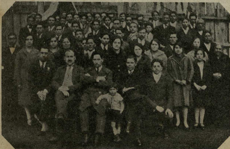
La reunión de la juventud evangélica de Lota y