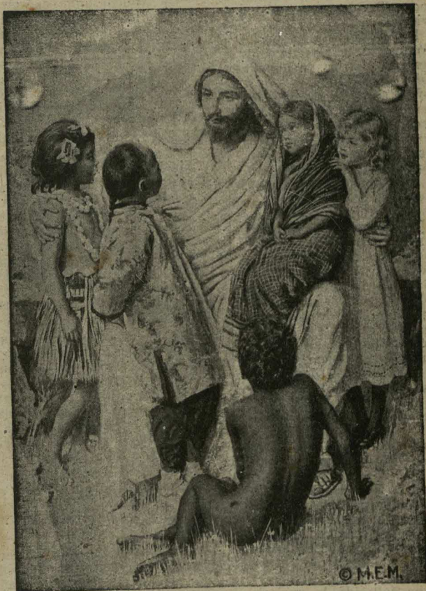
La Esperanza del Mundo