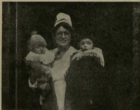
Enfermera de la Institución Sweet, de Santiago. (Metodista).—“Clínica para guaguas”