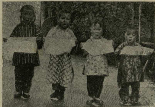
Estos niños chinos están cantando: "Gozo la Santa Palabra leer".

—Es un excelente hombre—dijo el rey, que bien conocía la lealtad y los méritos de su servidor—él sólo puede traer buenas noticias.