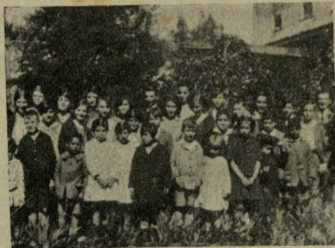
Un grupo de hijos de pastores y de predicadores locales, alumnos actualmente en el Colegio Americano y Concepción College, después de un almuerzo que les fué ofrecido en el Colegio Americano