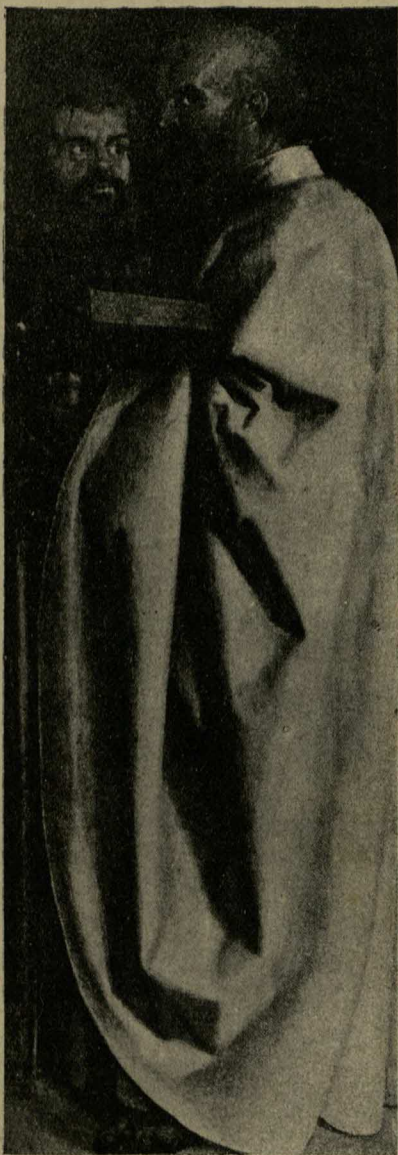
San Pablo y San Marcos.