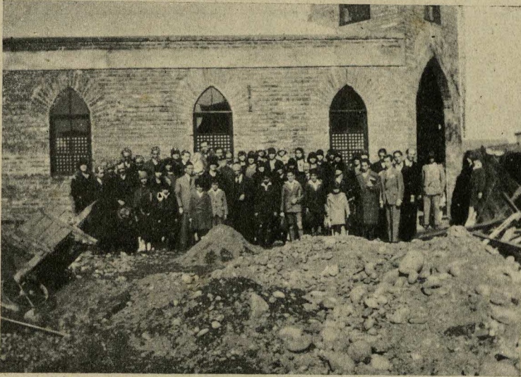
Un grupo de la Escuela Dominical de la Iglesia "La Unión Cristiana". Al lado norte del templo que está todavía en construcción.