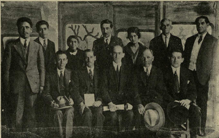
Santiago.—Oficiales de la Iglesia del Redentor.