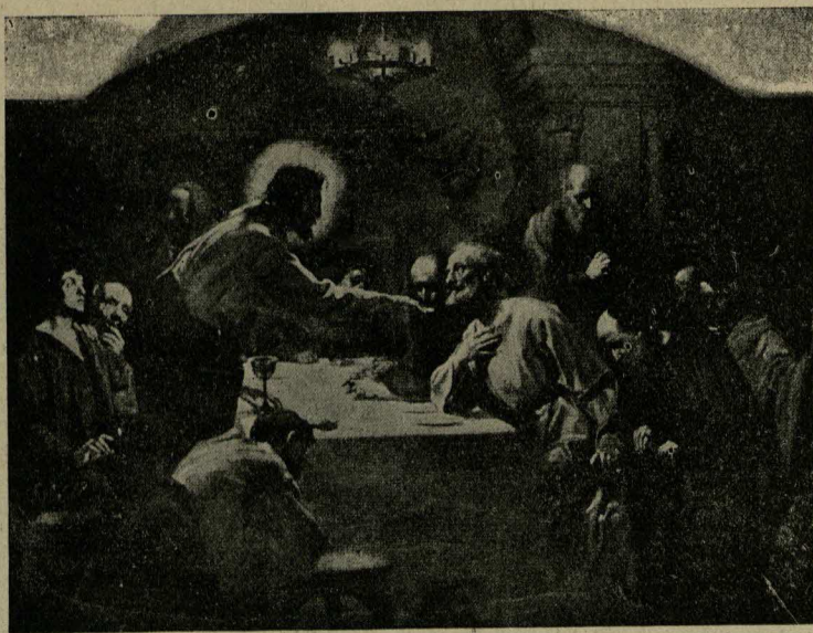
La última pascua.

En este período de la historia de la Iglesia, es probable que Juan Marcos estuviese residiendo en Roma. Parece que Pedro pasó sus últimos días en esa ciudad, y bien puede Marcos haberse quedado en ella. Podemos imaginarnos que algunos amigos suyos le hablaron en la forma siguiente: «Hermano Marcos, tú eras un amigo íntimo del Apóstol Pedro: debes, por lo mismo, haberle oído una y otra vez relatar incidentes relacionados con la vida de Jesús. Tú mismo viste