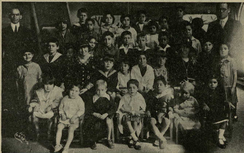
El Departamento infantil de la Escuela Dominical de la Iglesia del Redentor.

¿Cuántos suscriptores ha conseguido Ud. en lo que va del año para "El Heraldo Cristiano"?